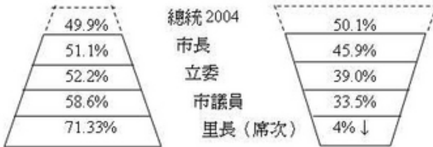
圖一、1998台北市藍綠得票率結構