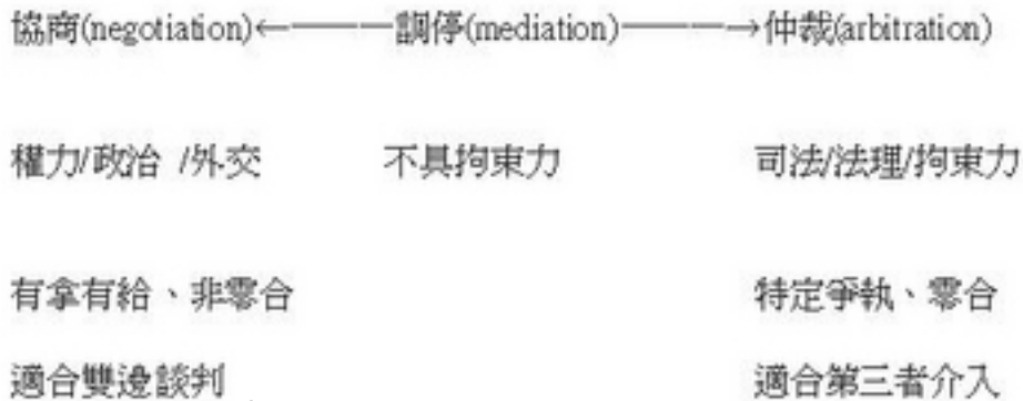
圖5-1 協商 vs. 仲裁 (製圖：洪財隆)