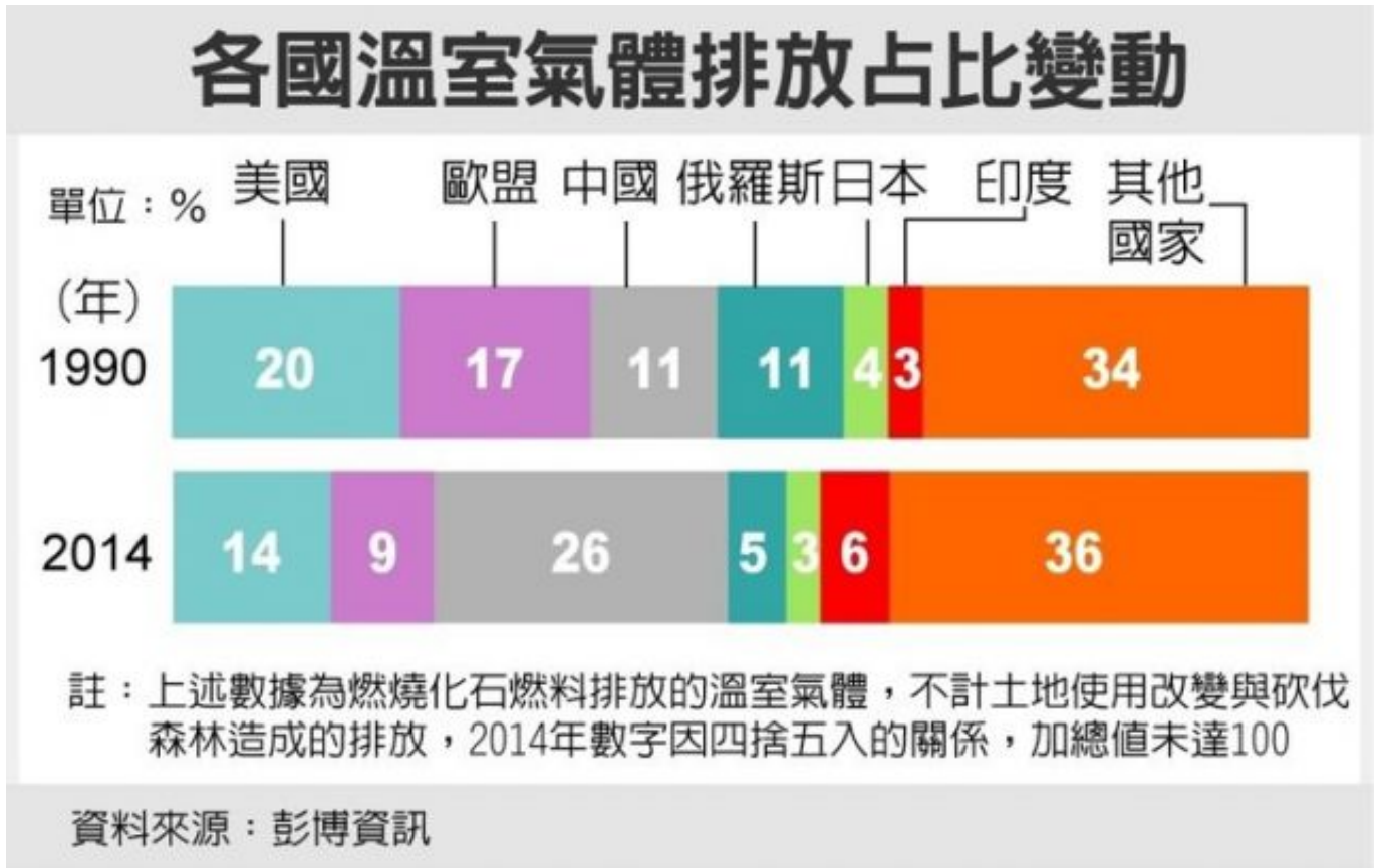
圖二、各國溫室氣體排放占比變動