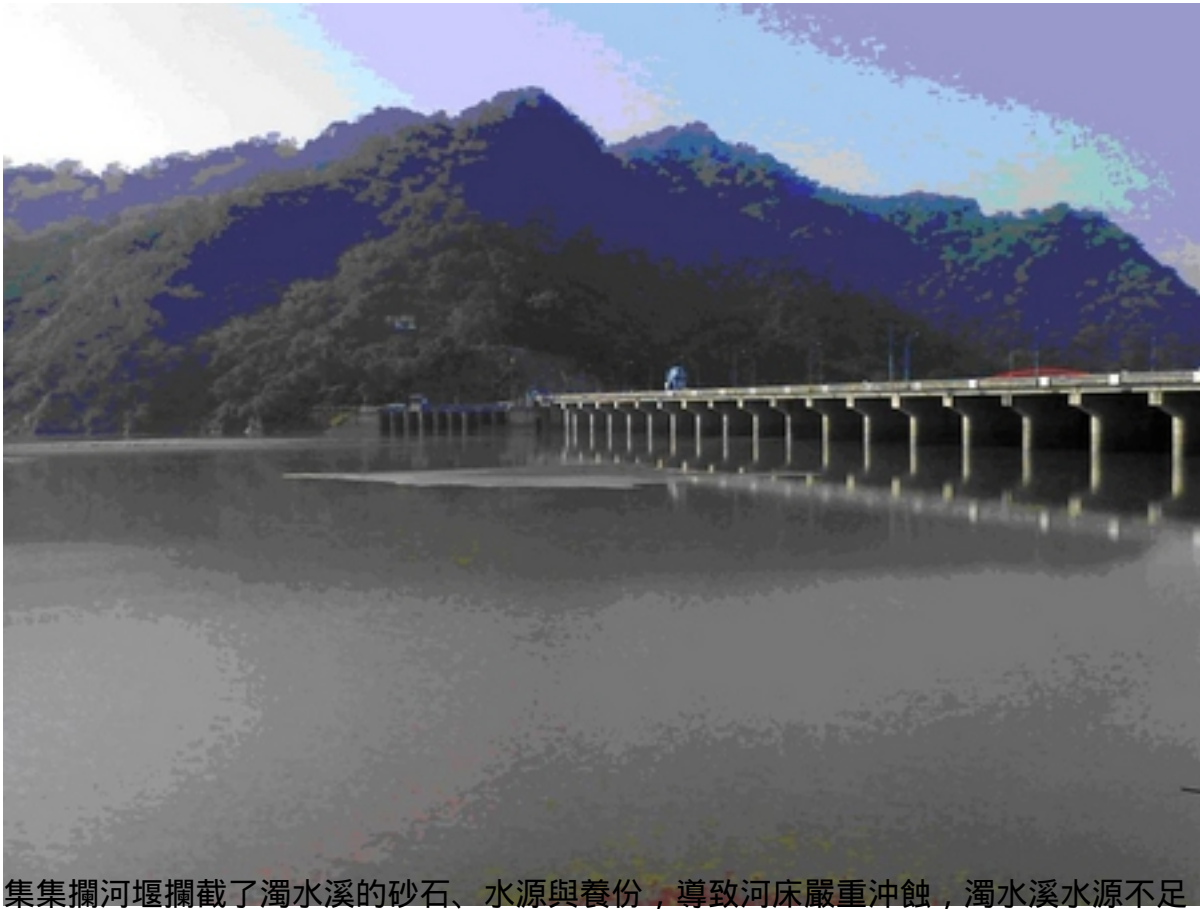
集集攔河堰攔截了濁水溪的砂石、水源與養份，導致河床嚴重沖蝕，濁水溪水源不足