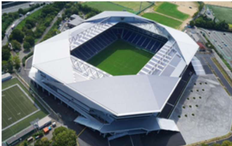
(圖4：Panasonic Stadium Suita主場俯瞰圖 https://suitacityfootballstadium.jp )