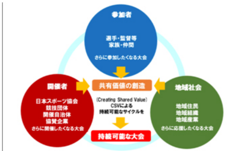
(圖5：日本スポーツマスターズ戦略プラン https://www.japan-sports.or.jp/masters/tabid193.html )

日本運動大賽是針對壯年世代之間的運動愛好者為了提升競技專業力而舉辦的活動，參加者也限制在 35 歲以上，每年都約有 8000 多人共襄盛舉。與上述定位為希望可以讓全民一起參與運動盛事的國民運動大會有所不同，日本運動大賽是為了提高青壯年世代的運動競爭力，也為已經步入職場後無法像校園時期能遇到志同道合體育社群的朋友創造享受運動的機會。並希望可以藉由該大賽能使參加者、主辦單位（如：地方政府、企業、在地運動俱樂部等等）社區之間的連結更加緊密，使「運動」這項價值能夠永續存在。