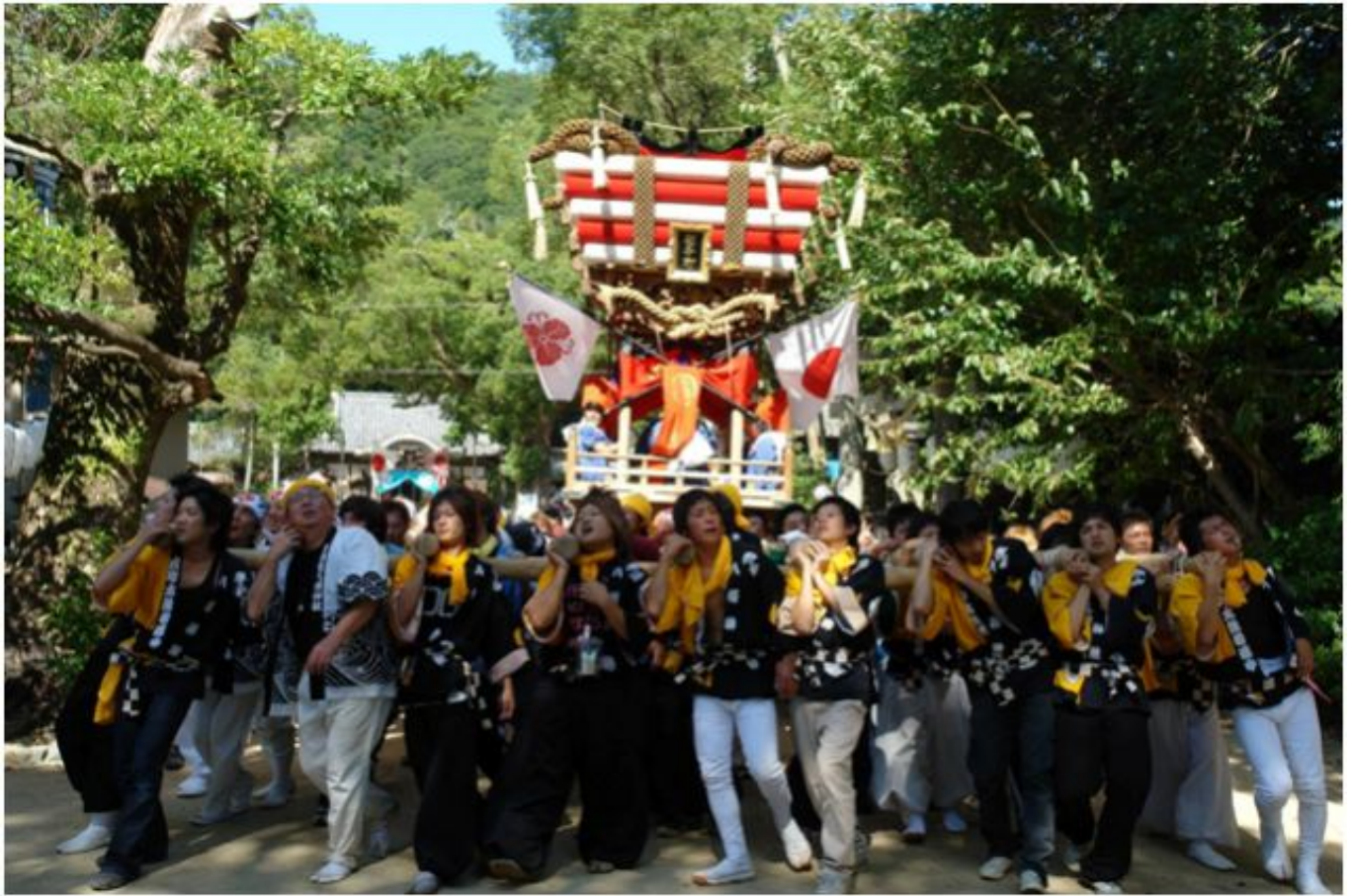
傳統祭典中當地居民及新移居青年共同舉辦狀況