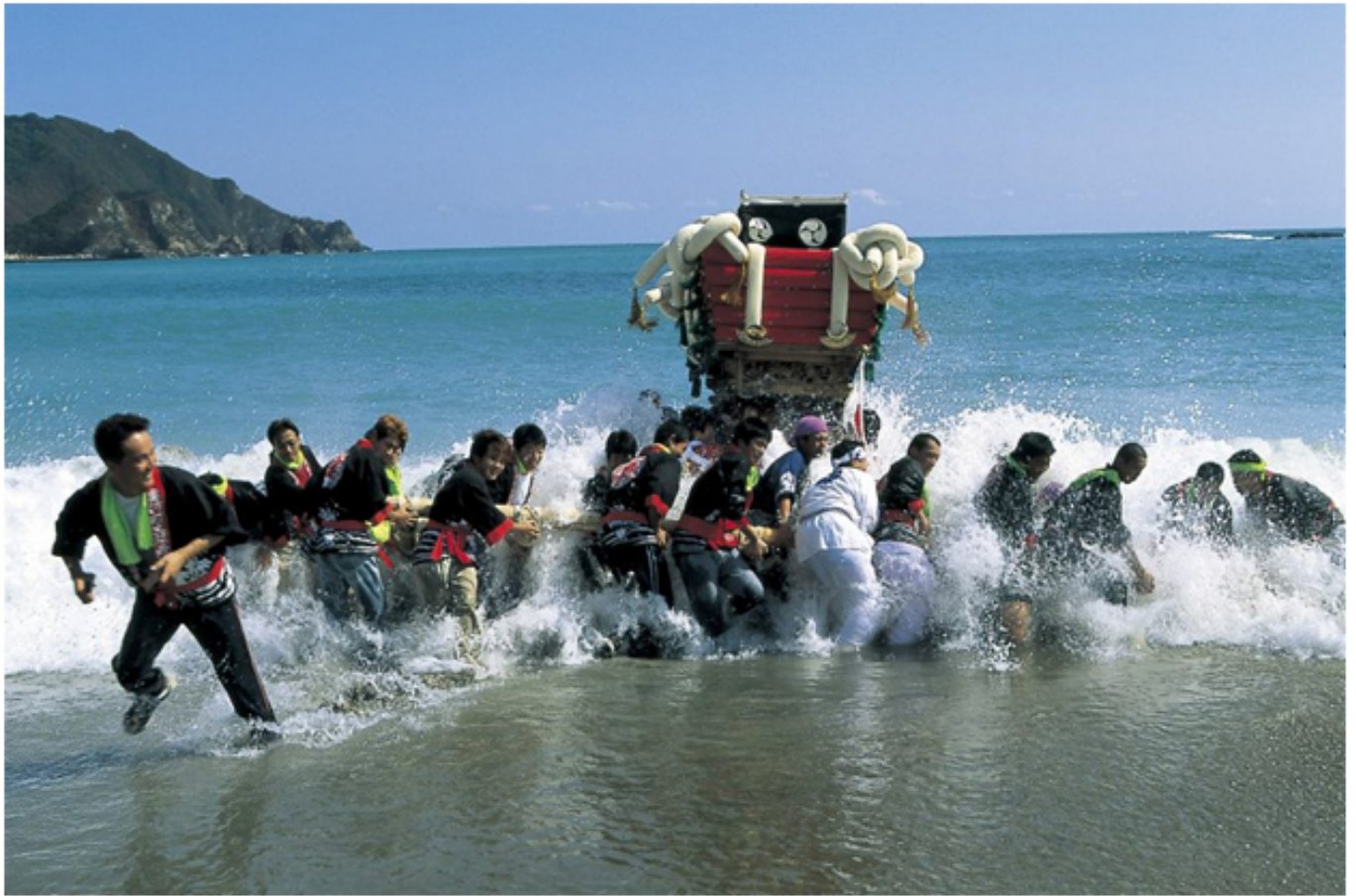
美波町日和佐八幡神社的傳統祭典