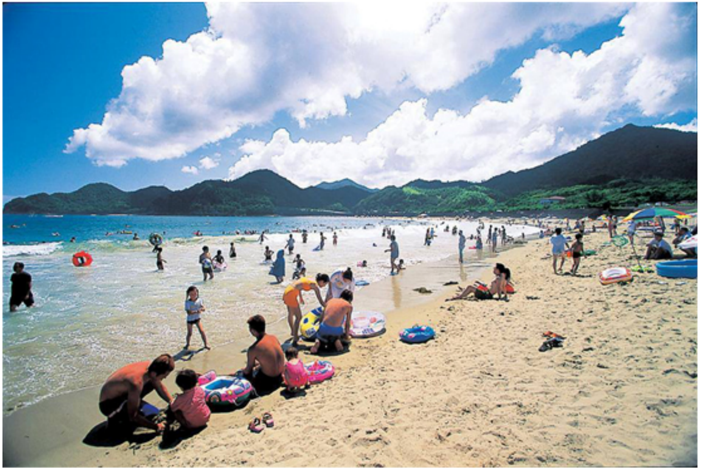
美波町の海水浴場