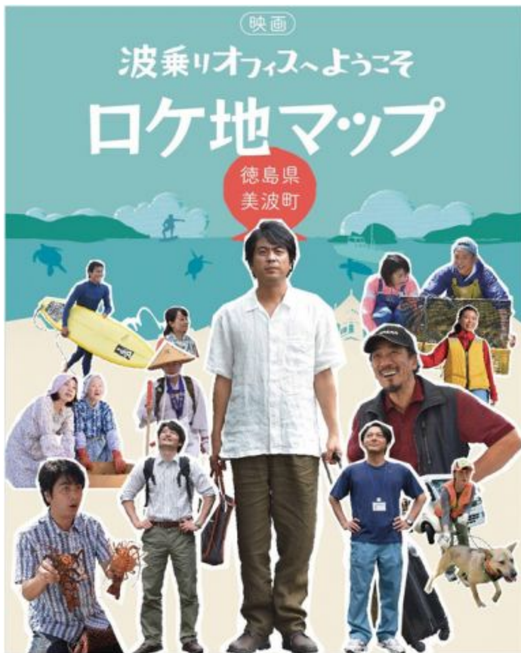
歡迎來到乘著浪花的衛星辦公室電影海報