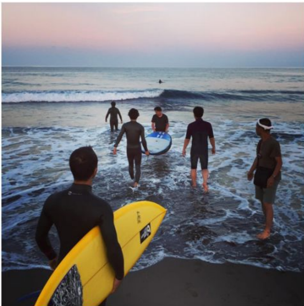
「歡迎來到乘著浪花的衛星辦公室」電影拍攝時一景