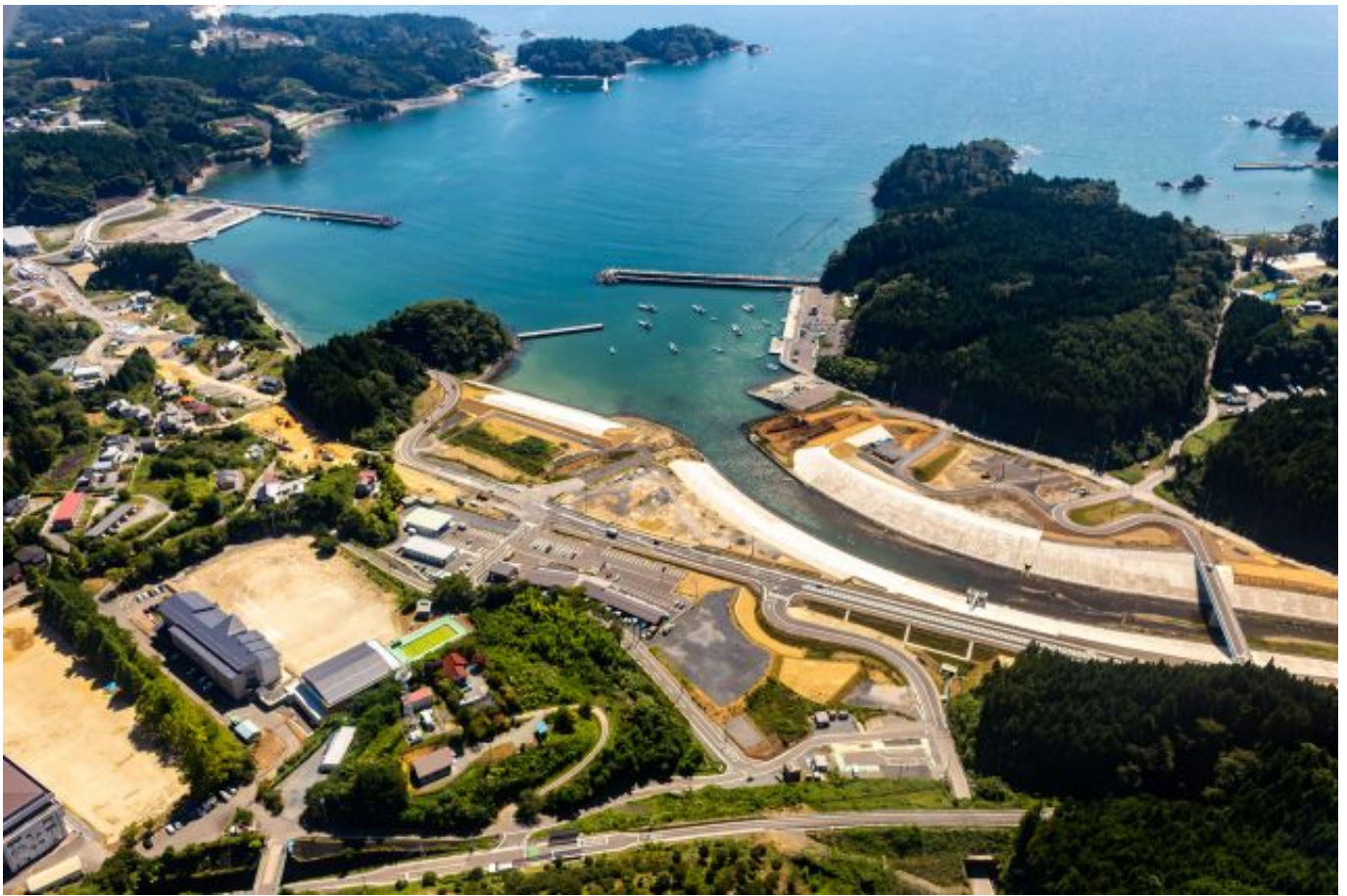
宮城縣南三陸町 (左下方：遷村高台。中間：防波堤以及住宅禁建區與商業設施用地)