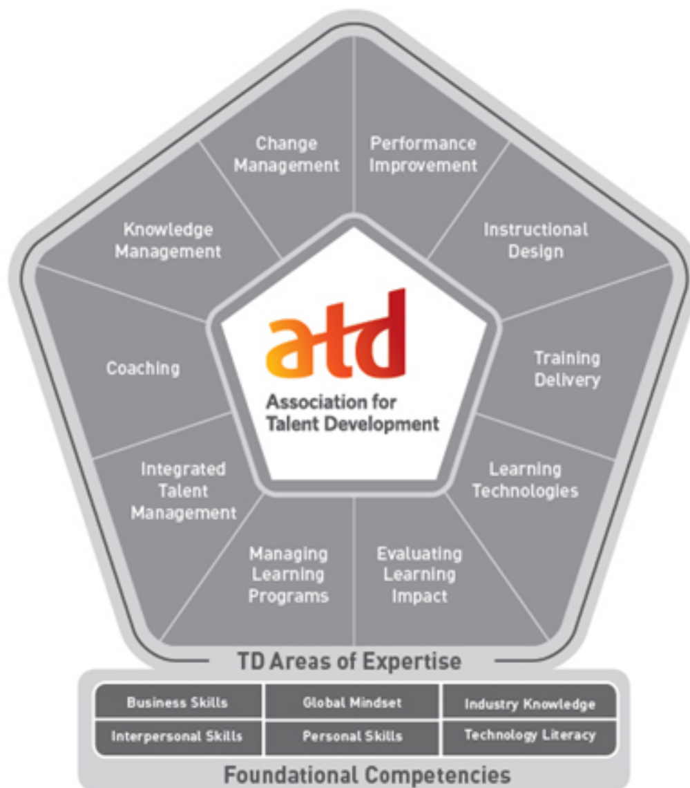
圖2、2014年ATD人才職能模型

其次，我國過去發展的全民共通核心職能（3Cs）課程，即動機職能（Driving Competency,