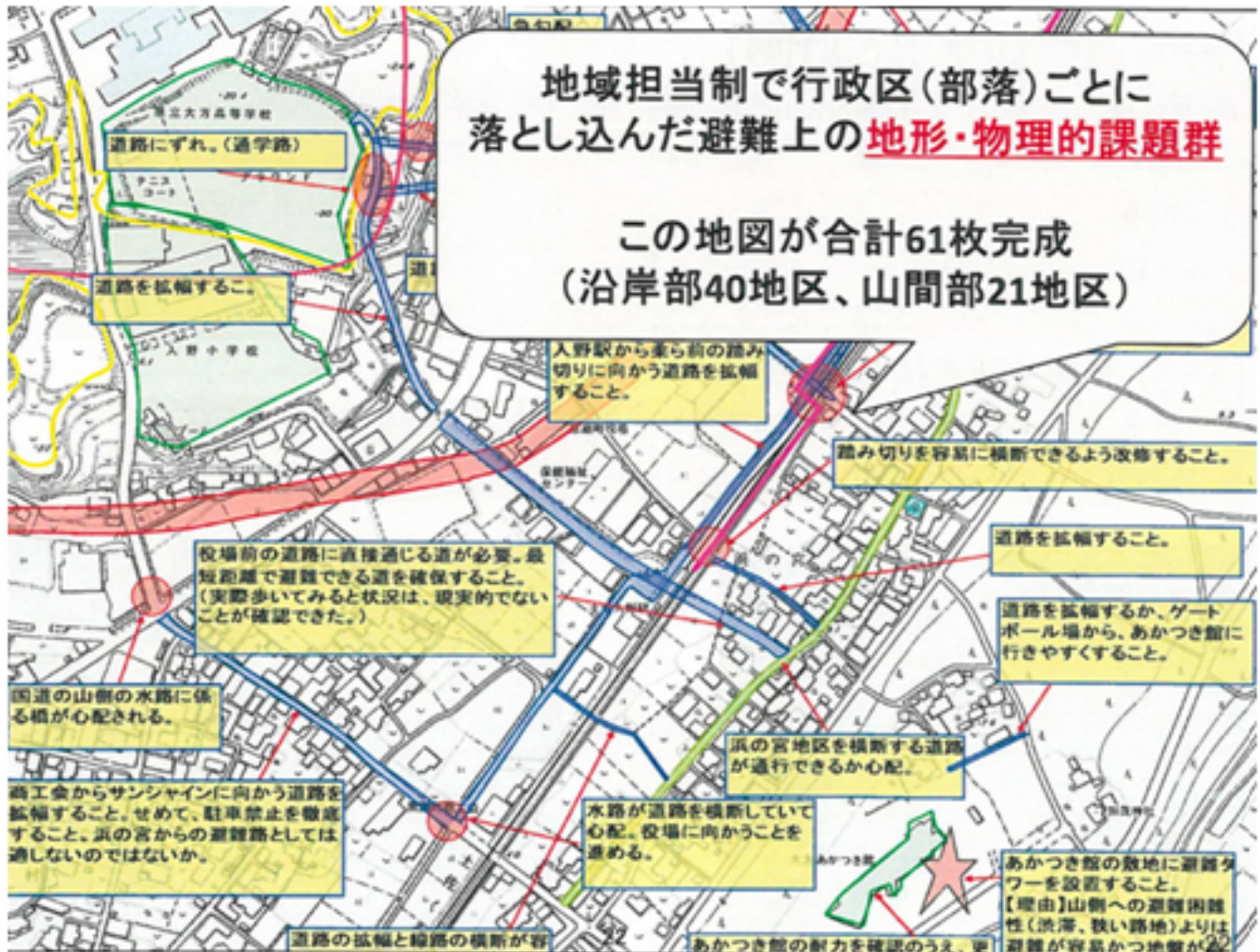
圖四：黑潮町内61個聚落避難所與避難地形道路的盤點調查。