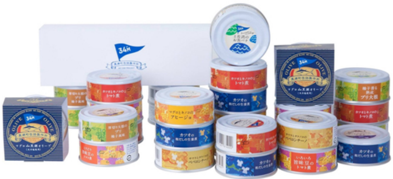
圖八：由黑潮町罐頭製作所公司設計的海料理罐頭防災備品。