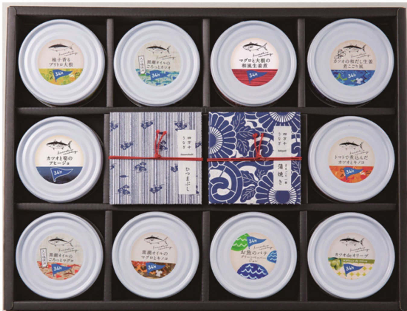
圖七：由34M公司設計的防海料理罐頭災備品。