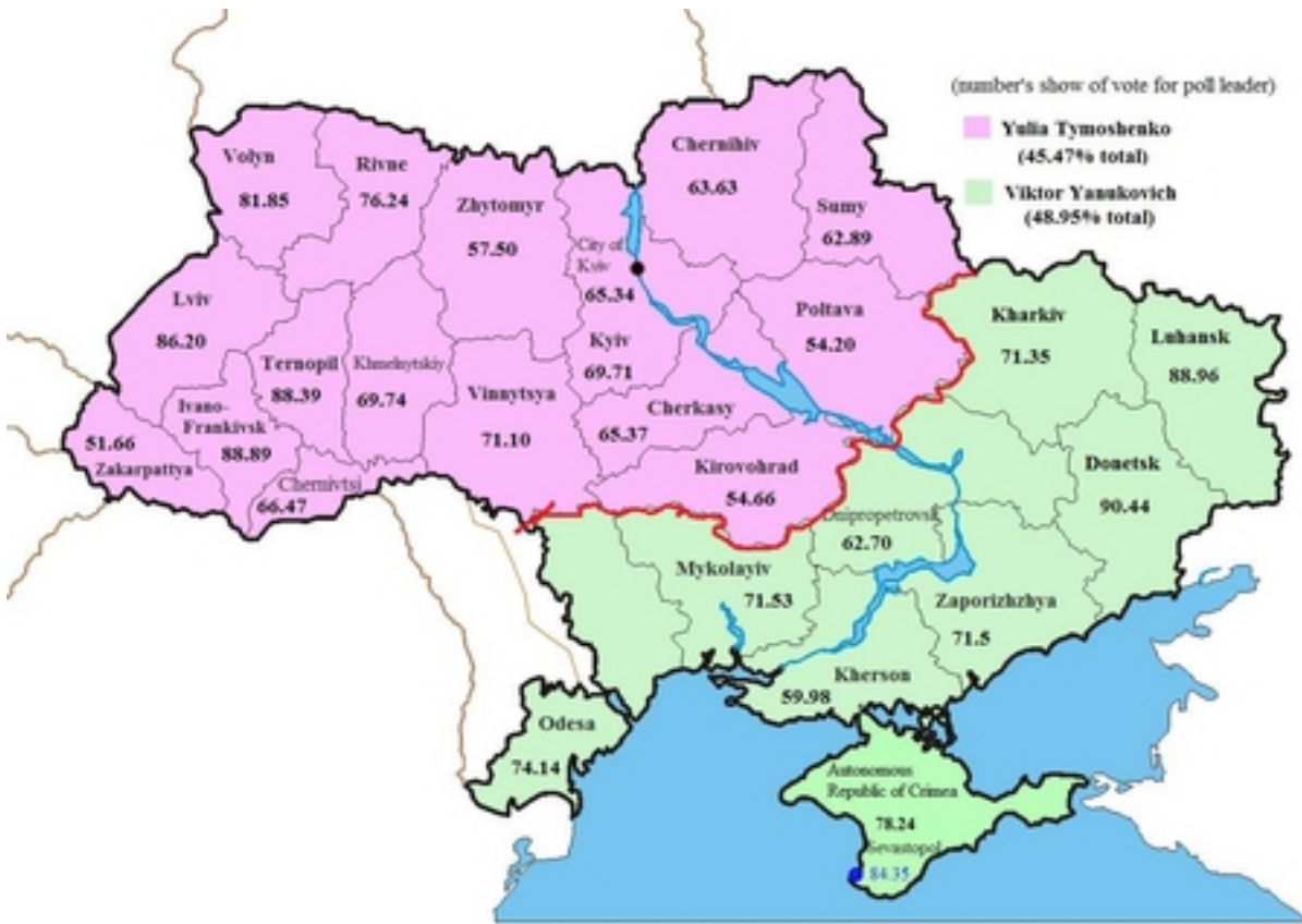
圖一：2010年總統大選結果候選人亞努科維奇與季莫申科獲票分佈圖